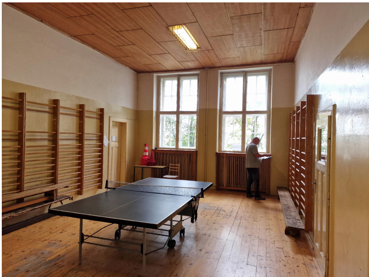
Obr. 3 – tělocvična vedlejší sál