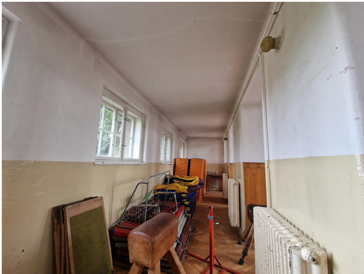
Obr. 5 – nářadovna