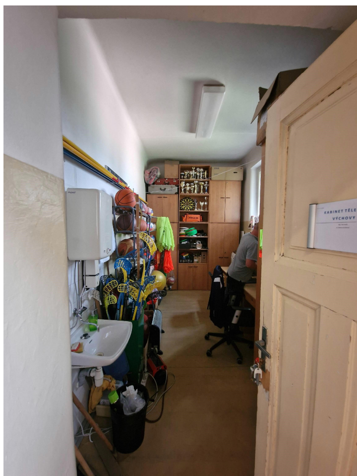
Obr. 6 - kabinet