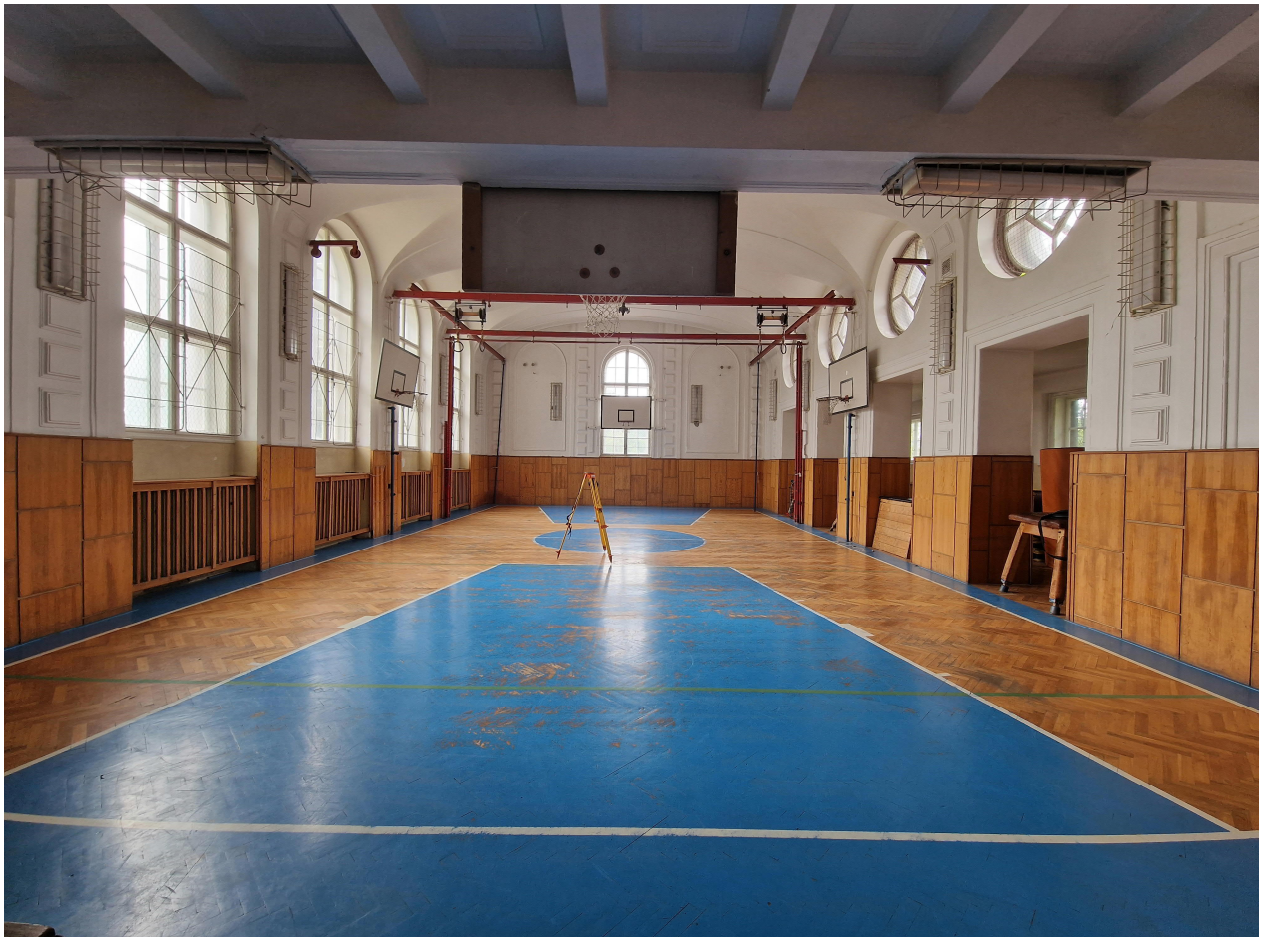
Obr. 1 – tělocvična hlavní sál