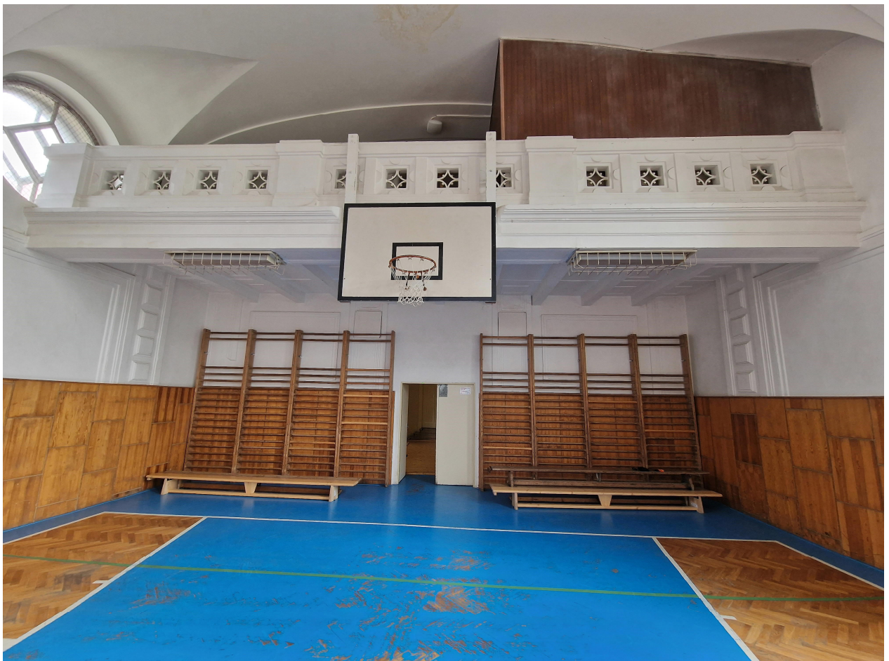
Obr. 2 – tělocvična hlavní sál