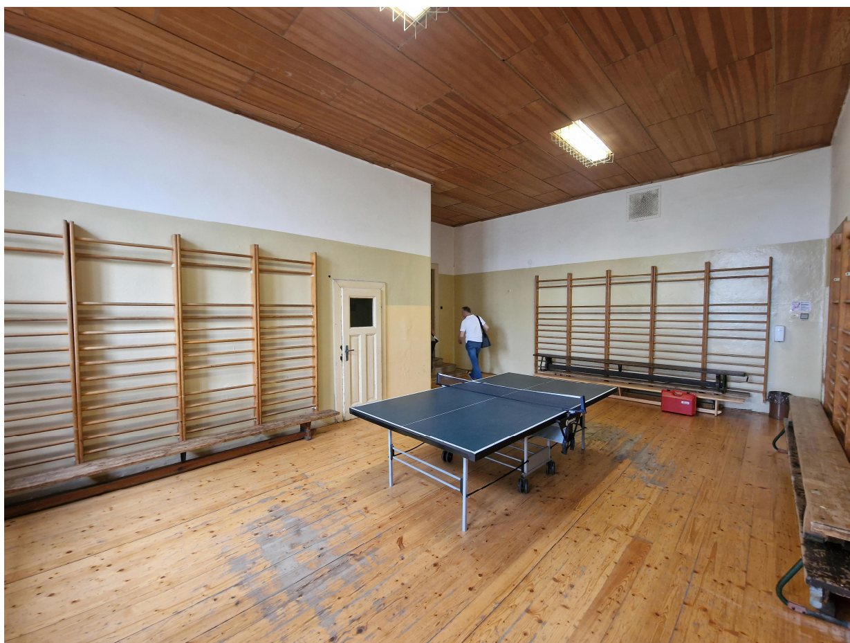
Obr.4 – tělocvična vedlejší sál